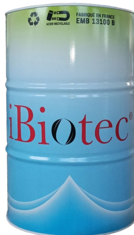
Sod 200 L