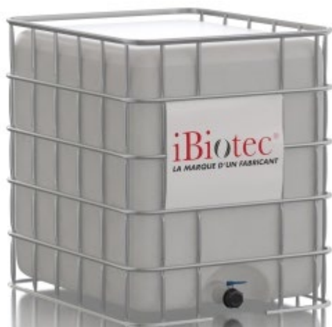
Kontejner GRV 1000 L